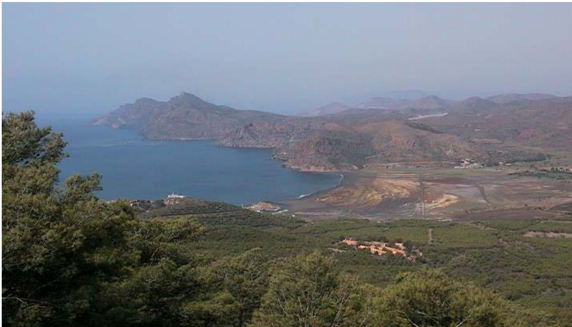
Deposición de estériles de mina en la Bahía de Portman, sierra minera Cartagena-La Unión.